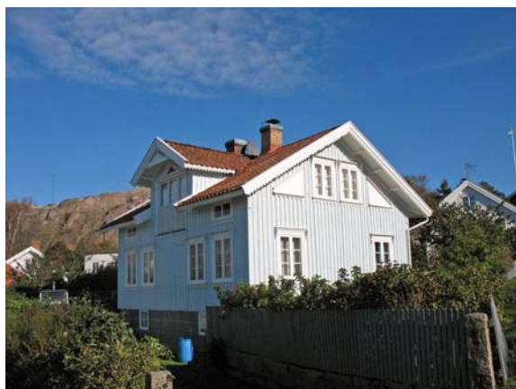
Exempel på byggnad ur den kulturhistoriska bebyggelseinventeringen