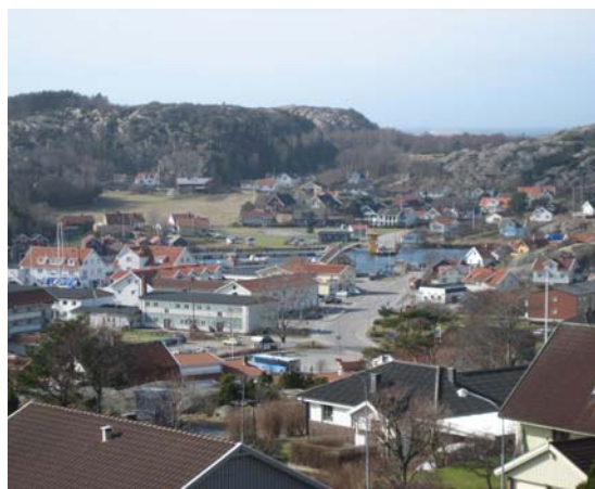
Vägen genom centrum