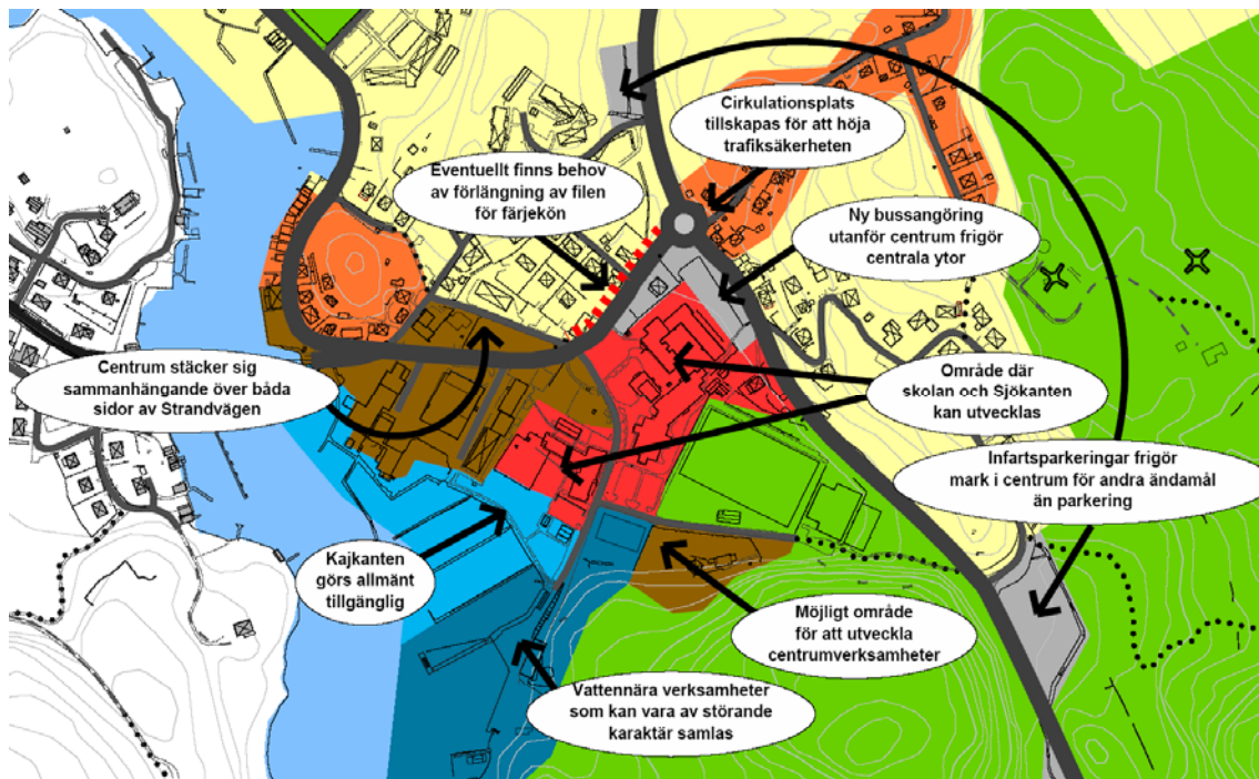
Förslag till åtgärder i centrum