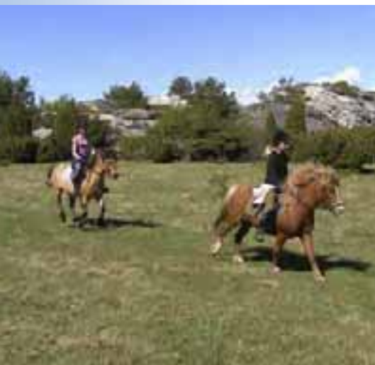
Naturreservaten ska bevaras och nyttjas

Tanken är att en del av utmarkerna ska efterlikna tidigare förhållanden när mångfald och artrikedomen var större.