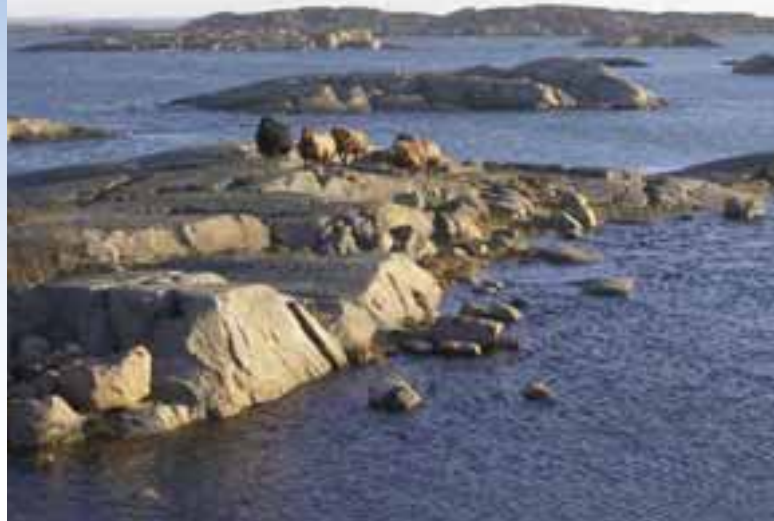
En brukad nationalpark innebär fiske, jakt, jordbruk m.m.

Sveriges första marina nationalpark kommer att ge ökad status till hela norra Bohuslän. Med riktlinjer och regelverk som anpassas till de lokala behoven säkras kustområdet inför kommande generationer. Bevarande och utveckling är inte motsatser utan kan ske i balans.