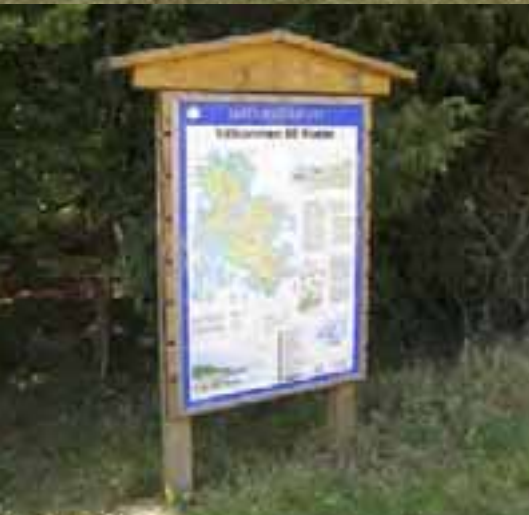
Upplysning om öarnas kulturarv och historia