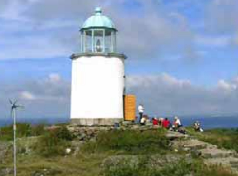
Större ekonomiskt stöd ger utrymme att bevara kulturarvet