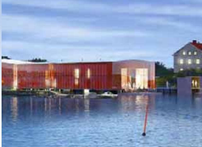
Vinnande förslag Mareld ska vidare bearbetas och anpassas

I Kosterundet planeras naturum Kosterhavet och eventuellt byggs någon mindre anläggning i Brevik. På fastlandssidan undersöks Strömstad, Tjärnö/Saltö, Rossö och Resö.