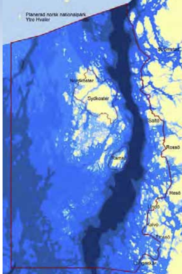
Kartan är preliminär och utgör ett förslag för parkområdet

Med allt finare undervattens-teknik kan man idag studera organismer direkt i sin naturliga miljö och få ökad förståelse för naturens samspel.