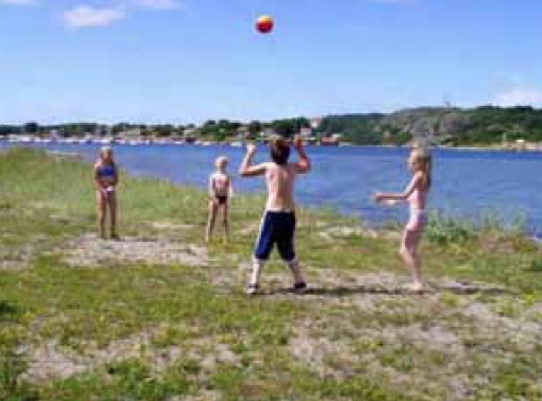
Naturreservaten får genom en nationalpark större ekonomiskt stöd