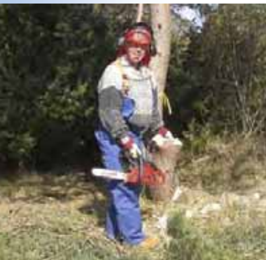
Skötsel av naturområden ger arbete

•Att komma ut i arkipelagen för dem som inte har tillgång till egen båt.