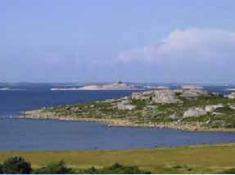
Bevara naturen och havet och bruka dem är inte motsatser