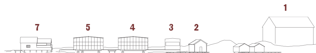
Husens höjd, sett från Nordkoster.