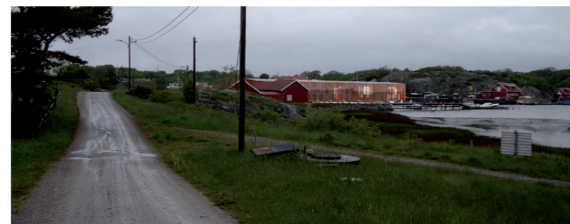
Naturum sett från Filjestadsvägen.

När naturum sänks med nästan två meter i det nya förslaget smälter byggnaden in i den befintliga bebyggelsen på ett bättre sätt än tidigare och lämnar mer sikt mot sundet fri.