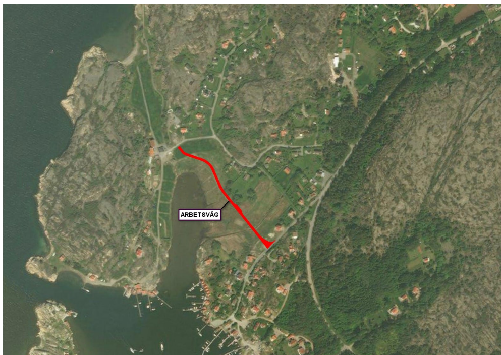
Under projektets gång kommer en tillfällig väg att anläggas, se röd markering i bilden. Detta eftersom vägen till Vikarna inte kommer vara framkomlig under tiden som det arbetas med VA-ledningar m.m. i den.