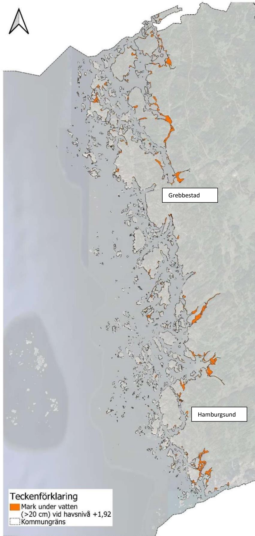
Figur 3. Översikt över kustområden där mark översvämmas med mer än 20 cm vid en havsnivå om +1,92 (RH2000), enligt den Scalgoanalys som har utförts i skyfallsanalysen. Kartbilden visar kommunens kustlinje. Hela kommunen har ingått i analysen.