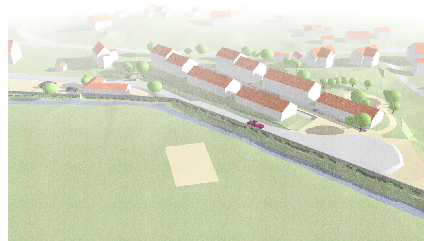
Fågelvy från nordväst