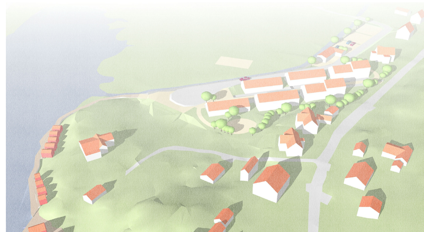
Fågelvy från söder