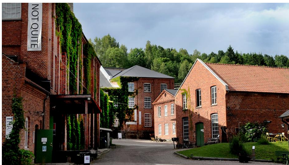
Not Quite i Åmåls kommun.