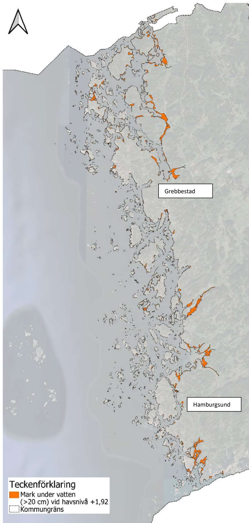
Figur 3. Översikt över kustområden där mark översvämmas med mer än 20 cm vid en havsnivå om +1,92 (RH2000), enligt den Scalgoanalys som har utförts i skyfallsanalysen. Kartbilden visar kommunens kustlinje. Hela kommunen har ingått i analysen.