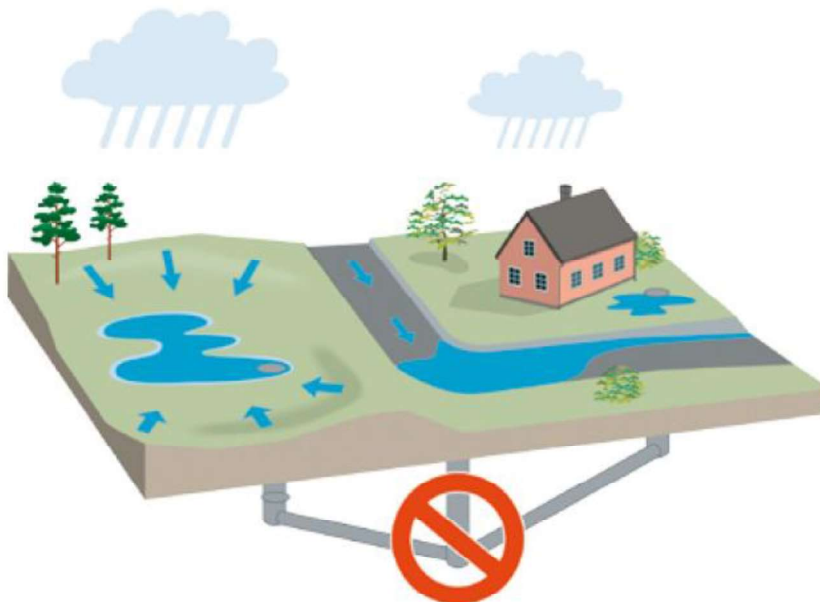
Figur 2. Princip för kartering av lågpunkter och rinnvägar. Ingen hänsyn tas till ledningsnätets kapacitet. Figuren är hämtad från MSB:s vägledning för skyfallskartering (MSB, 2017).

Notera att analysen är utförd för resultat från ett statiskt verktyg och saknar därmed dynamiken vid avrinning, både över mark och i ledningsnät. Analysen är topografiskt grundad och räknar med en obegränsad avrinning för valt regndjup inom avrinningsområdena.