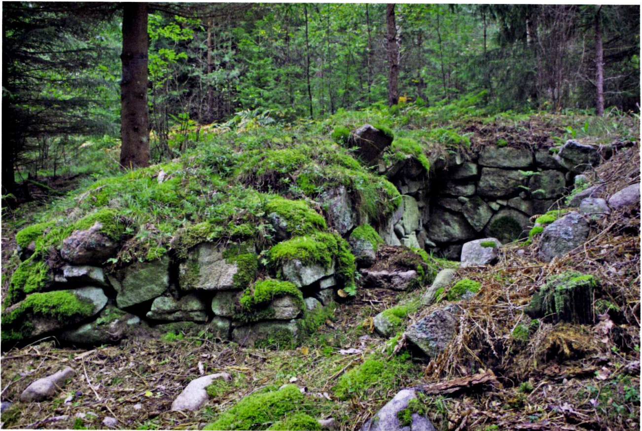
Rester av Jansetorpets jordkällare.